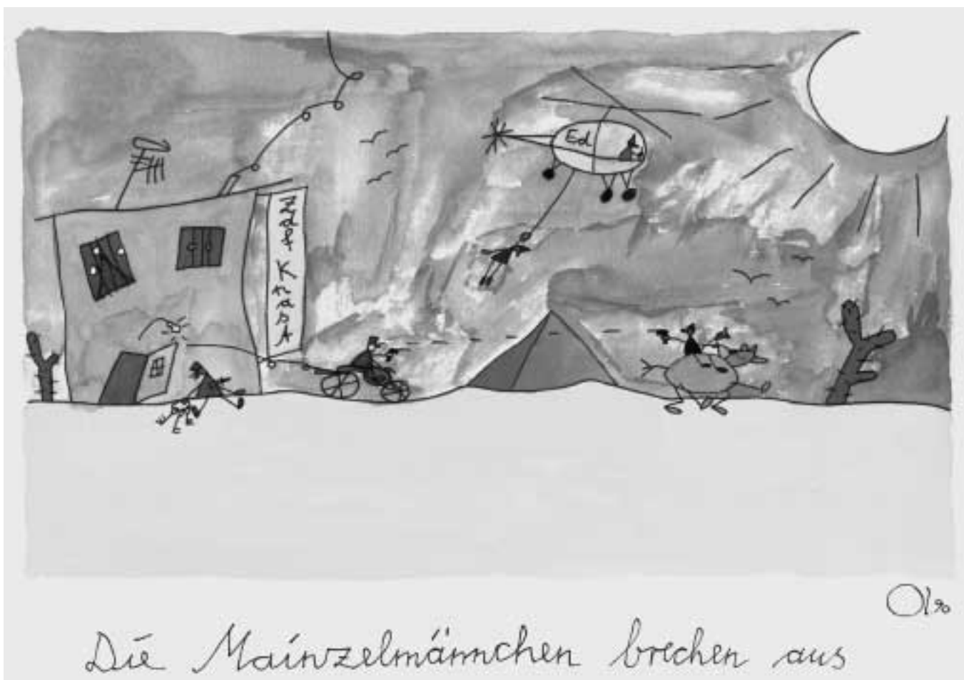
Die Mainzelmännchen brechen aus. 1990, Bleistift und Aquarell auf Büten, 47,8 x 35,8 cm. Verbleib unbekannt