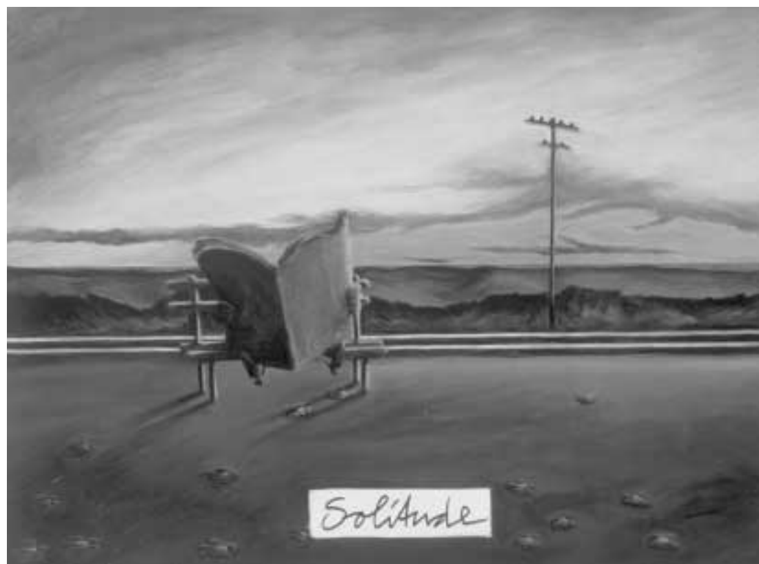
Solitude. 2002, Acryl auf Leinwand, 80 x 60 cm. Sammlung Gade, Stahnsdorf