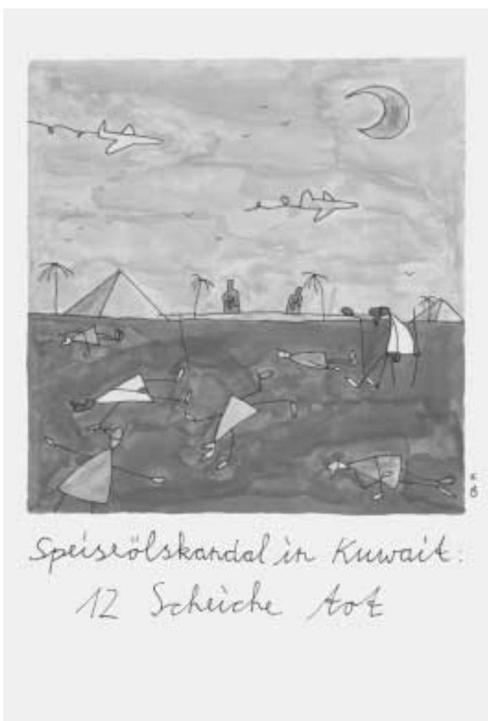
Speiseölskandal in Kuwait. 1991, Aquarell und Tusche auf Japanpapier, 60 x 82 cm. Privatbesitz, Berlin