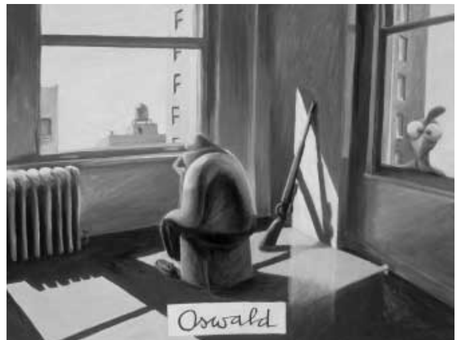
Oswald. 2001, Acryl auf Leinwand, 80 x 60 cm. Im Besitz des Künstlers