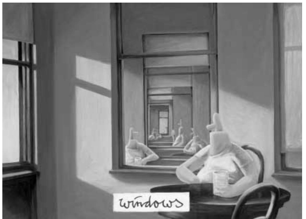
Windows. 2002, Acryl auf Leinwand, 80 x 60 cm. Privatbesitz, Berlin