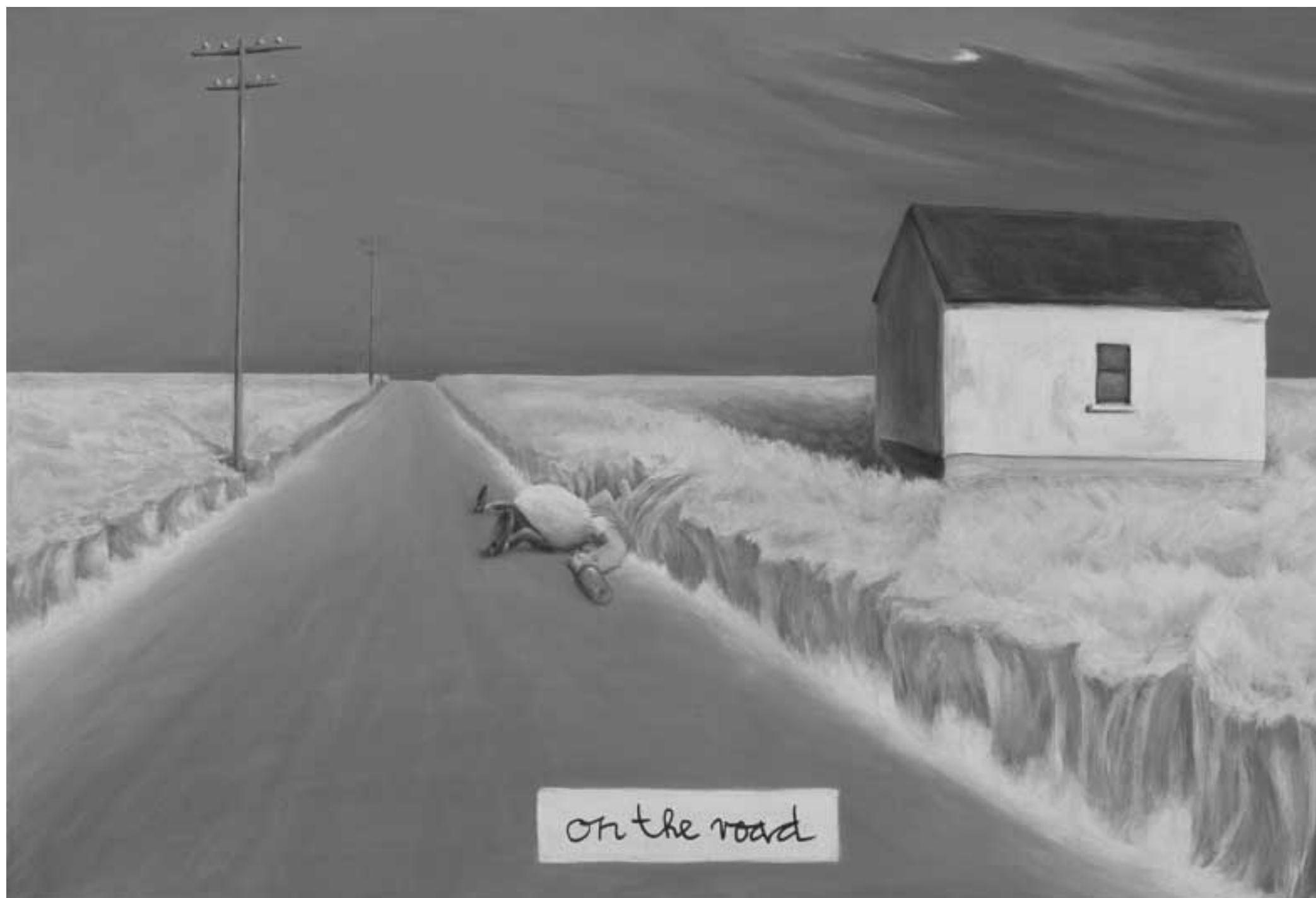
On the Road. 2001, Acryl auf Leinwand, 90 x 60 cm. Im Besitz des Künstlers