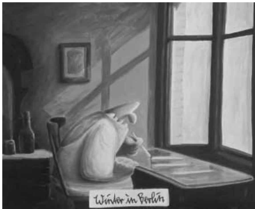
Winter in Berlin. 2000, Acryl auf Leinwand, 60 x 50 cm. Privatsammlung Jeffreys, Berlin