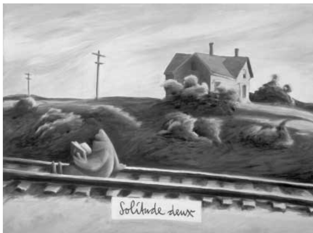
Solitude deux. 2000, Acryl auf Leinwand, 80 x 60 cm. Im Besitz des Künstlers