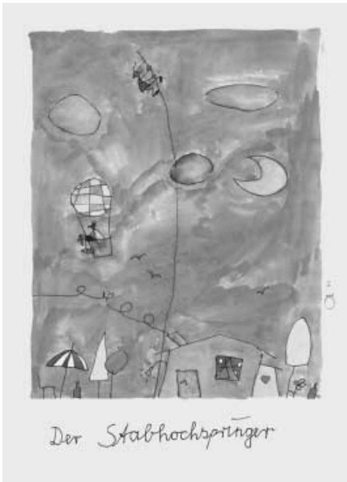
Der Stabhochspringer. 1990, Bleistift und Aquarell auf Büten, 29,7 x 42 cm. Im Besitz des Künstlers