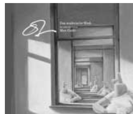
Vorabdruck mit freundlicher Genehmigung des Verlags. OL: Das malerische Werk. Mit einem Vorwort von Max Goldt. Edition Galerie Vevais, Vevais 2005, 64 Seiten, 29 Euro. © für das Vorwort: Max Goldt. Das Buch erscheint dieser Tage. Vielen Dank an Ingo Krepinsky, die Typonauten, Bremen.