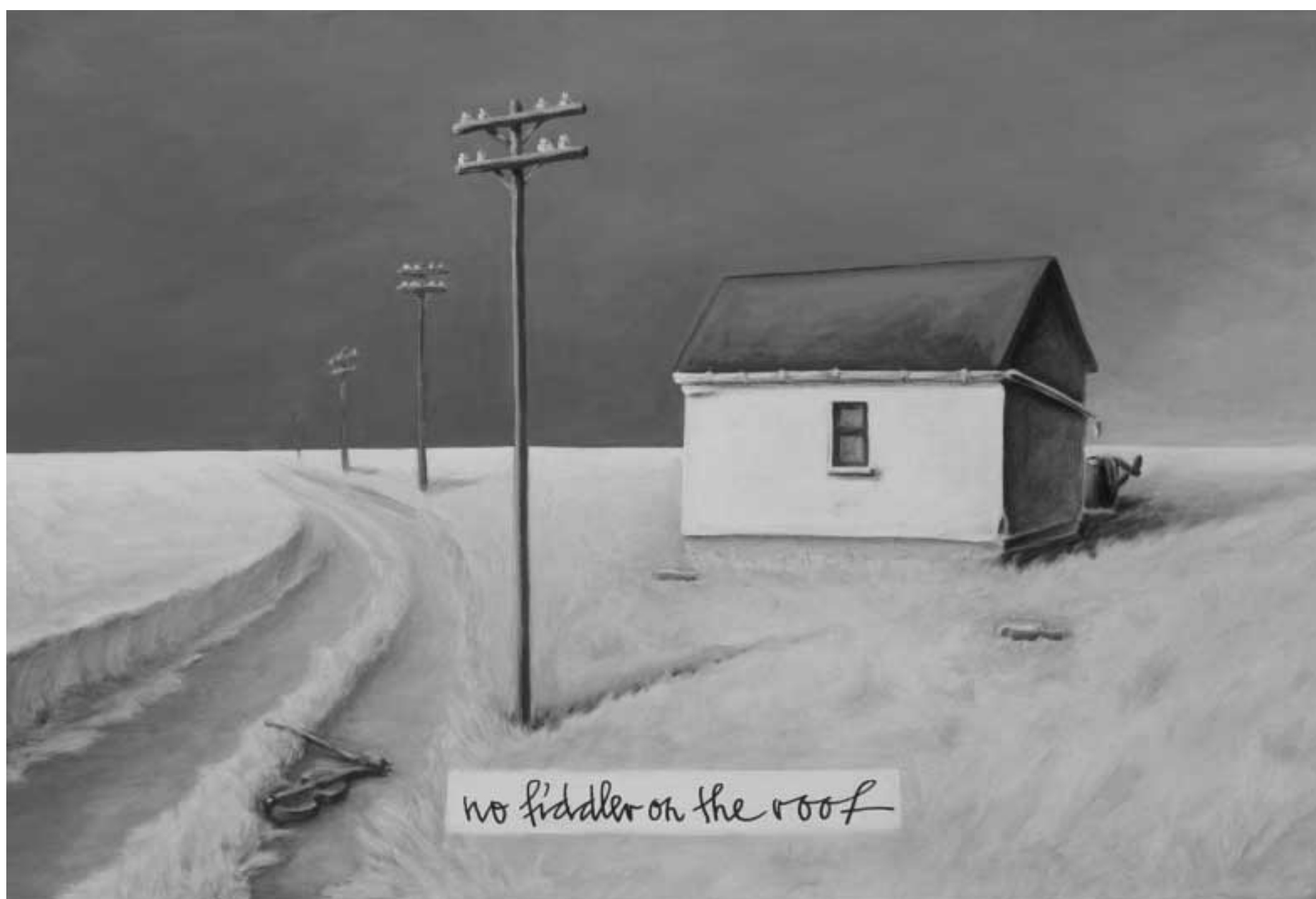
No Fiddler on the Roof. 2002, Acryl auf Leinwand, 90 x 60 cm. Privatbesitz, Berlin