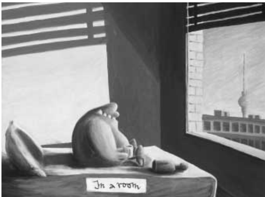
In a Room. 2000, Acryl auf Leinwand, 80 x 60 cm. Sammlung der Galerie Vevais, Vevais